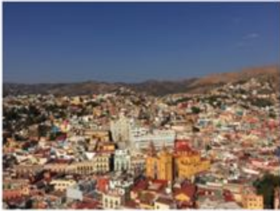
世界遺産グアナファト (2018年1月 坂本優紀 撮影)