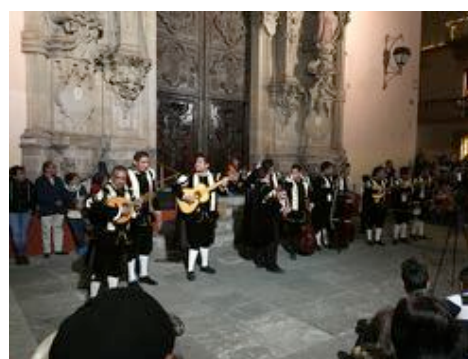
写真3 マリアッチの演奏（2018年1月撮影）

きました。18世紀には世界の3分の1の銀を産出し、メキシコで一番美しい町を作り上げました。現在銀の採掘量は大幅に減っている一方で、「文化の街」として音楽や美術などの芸術が街中の至る所でみられます。写真3は夜になるとエストゥディアンティーナ Estudiantina と呼ばれる楽団が教会の前で音楽を奏でている様子です。ここでは様々な国籍の観光者が音楽を楽しんでいます。国籍や民族を超えるラテンアメリカの音楽とはどのようなものなのかという興味関心のもと調査しています。