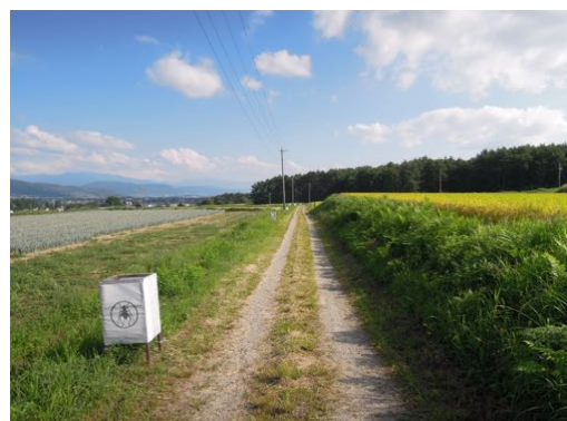
写真1 スズムシ生息地（2016年9月撮影）