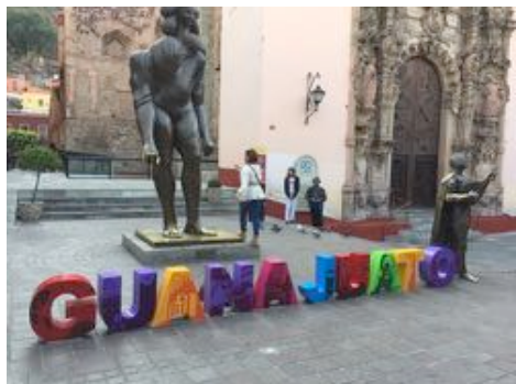
写真2 観光地グアナファト（2018年1月撮影）

たスズムシを駅や役場、宿泊施設などに設置しており、村内の至る所でスズムシの鳴き声を聞くことができます。スズムシは地域を代表する音として、村民に親しまれています。